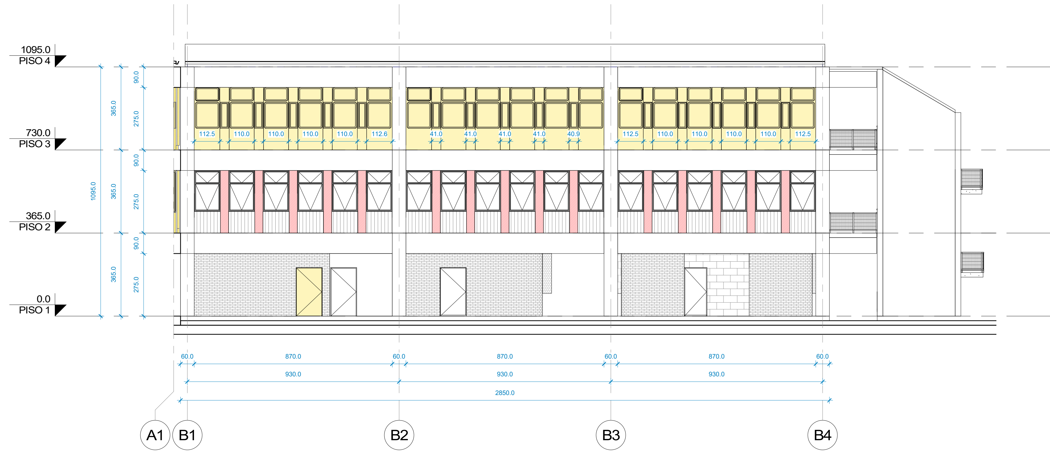
1 ELEV N - PB - DEMOLICIÓN 1 : 100