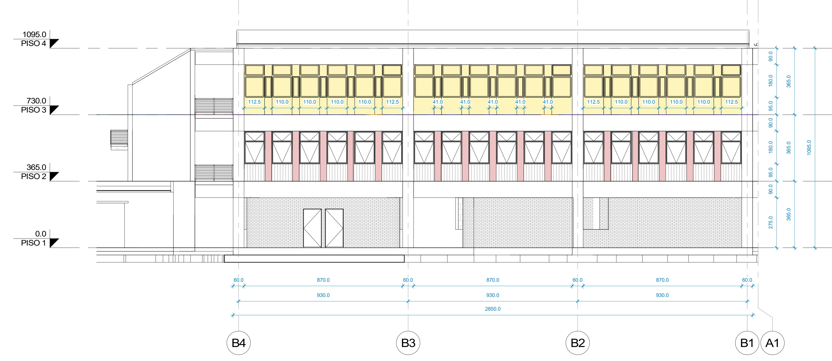
3 ELEV S - PB - DEMOLICIÓN 1 : 100