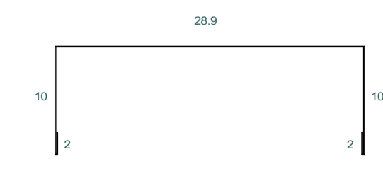
HOJALATERIA ESCANTILLÓN D