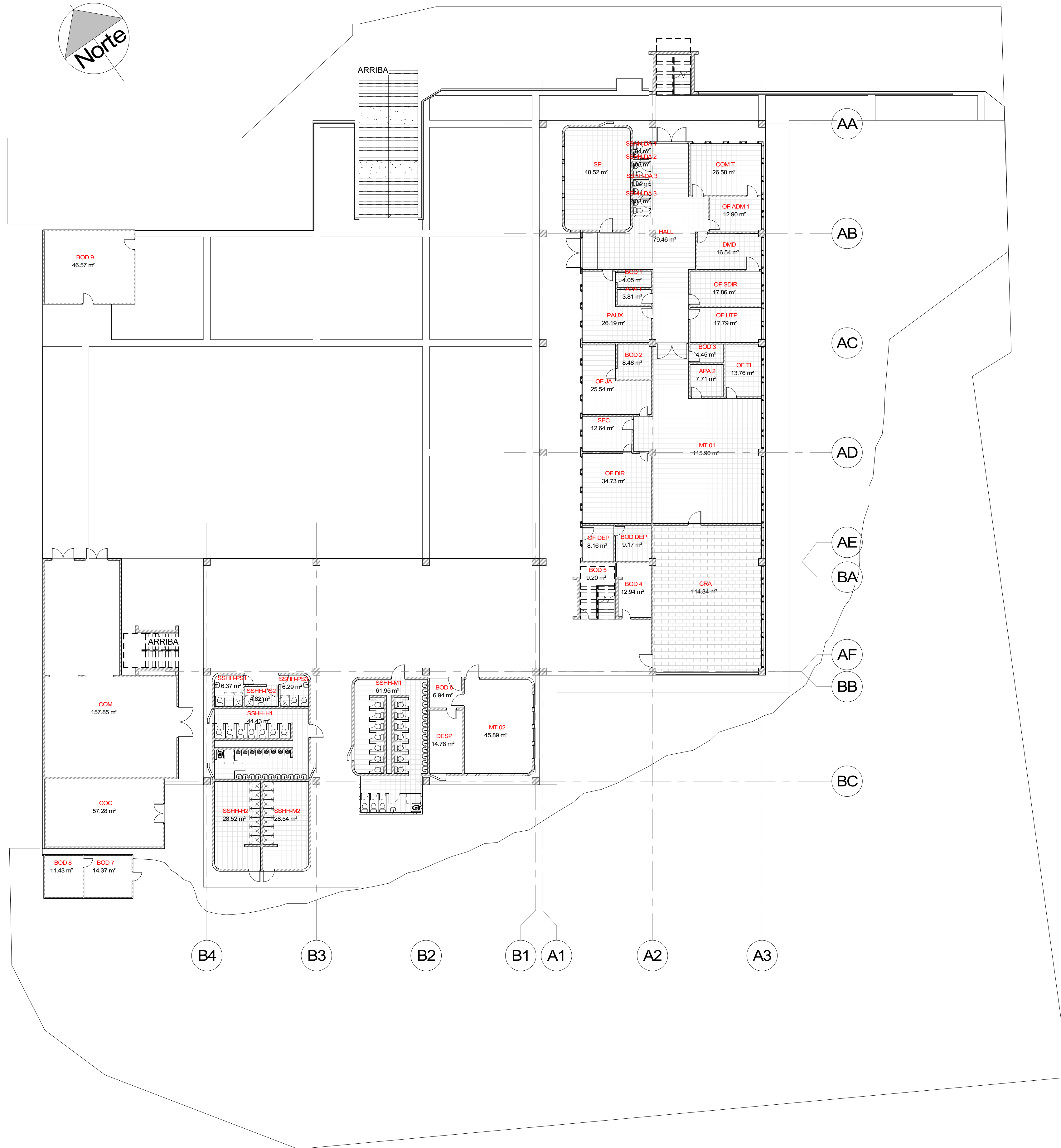
1 PISO 1 - FASE ACTUAL